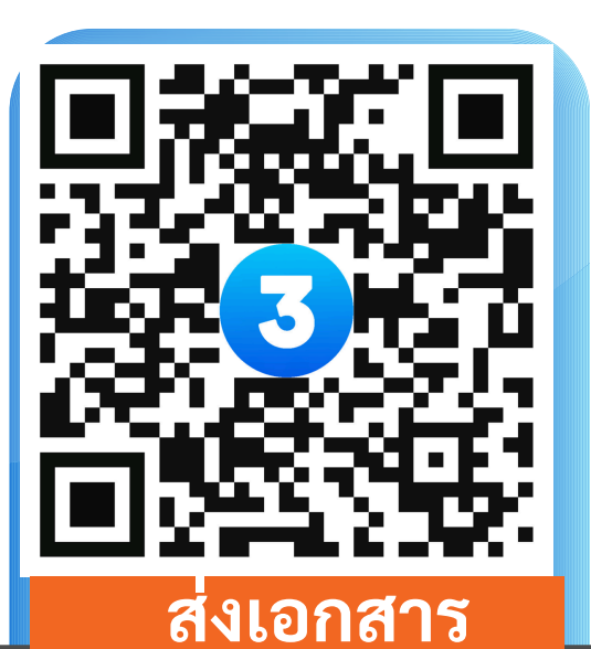
ส่งเอกสาร