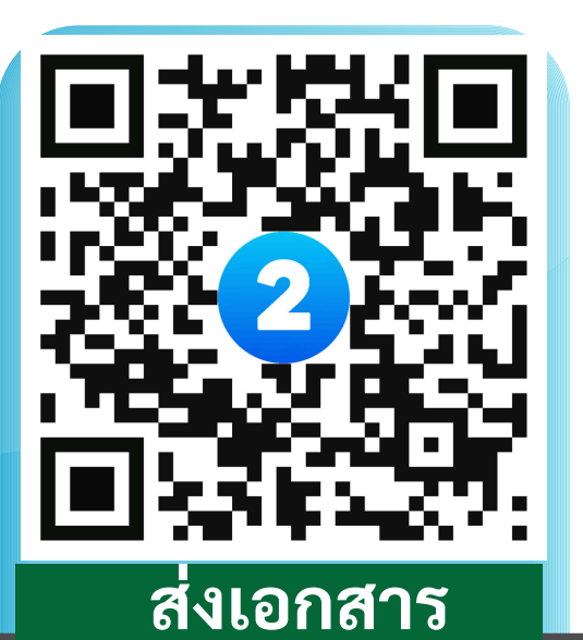
ส่งเอกสาร