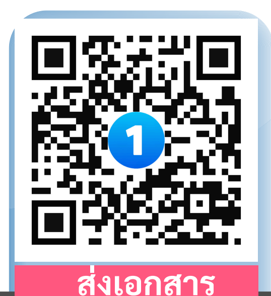
ส่งเอกสาร

สถานศึกษาเข้าร่วมเป็นโรงเรียนส่งเสริมกิจกรรมทางกาย