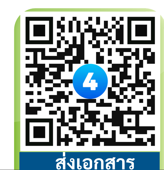
ส่งเอกสาร