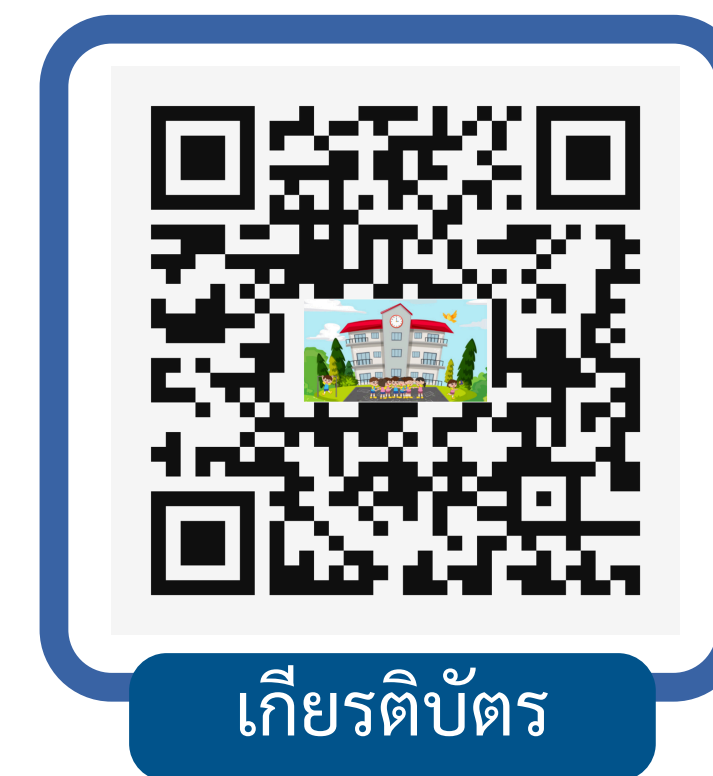
เกียรติบัตร