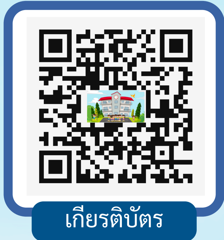
เกียรติบัตร